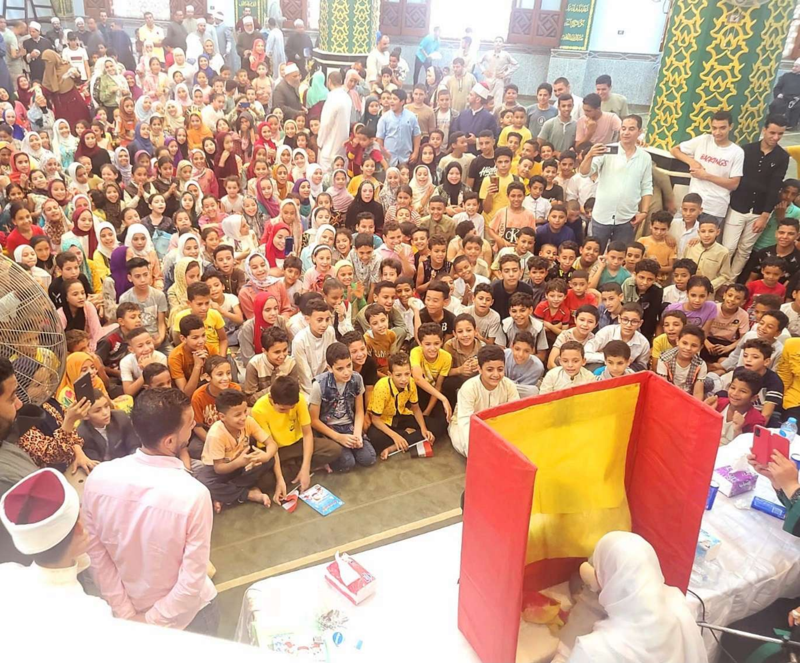
البرنامج الصيفي ٢٠٢٣م - مسجد مسعود حسن - عزبة السعدانة - كوم أشفين - القليوبية