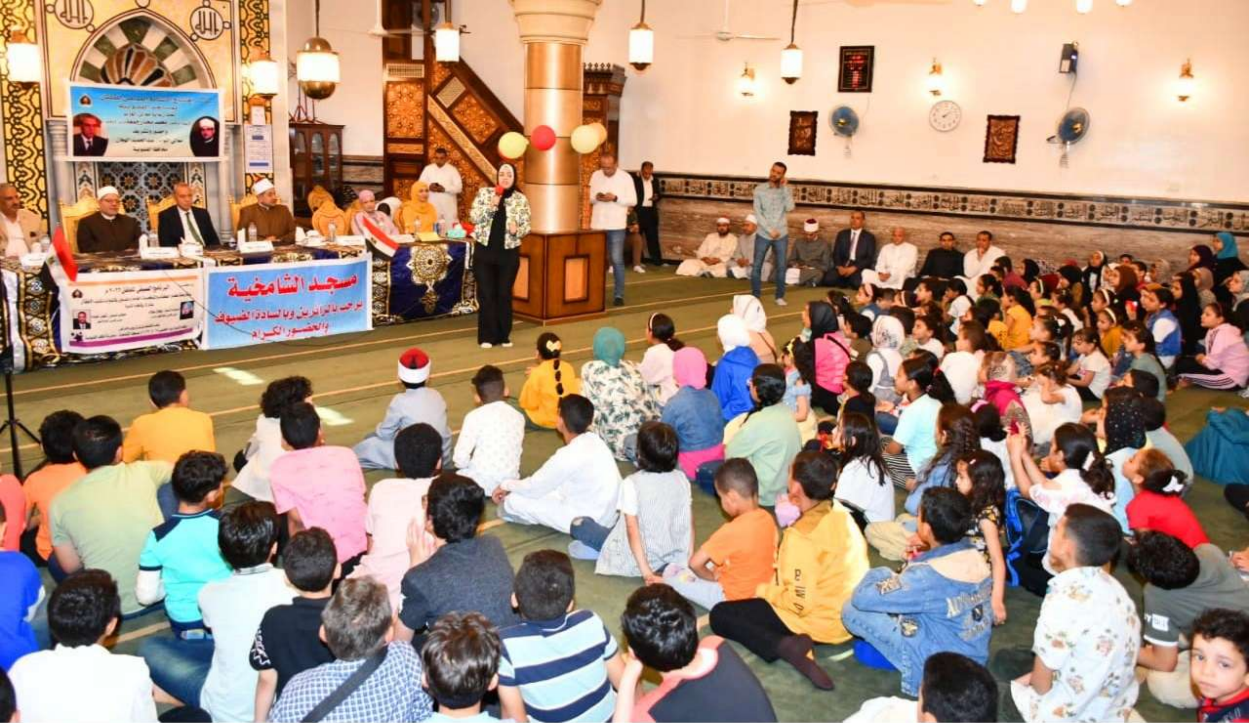
البرنامج الصيفي ٢٠٢٣م - من مسجد الشامخية - بنها - القليوبية