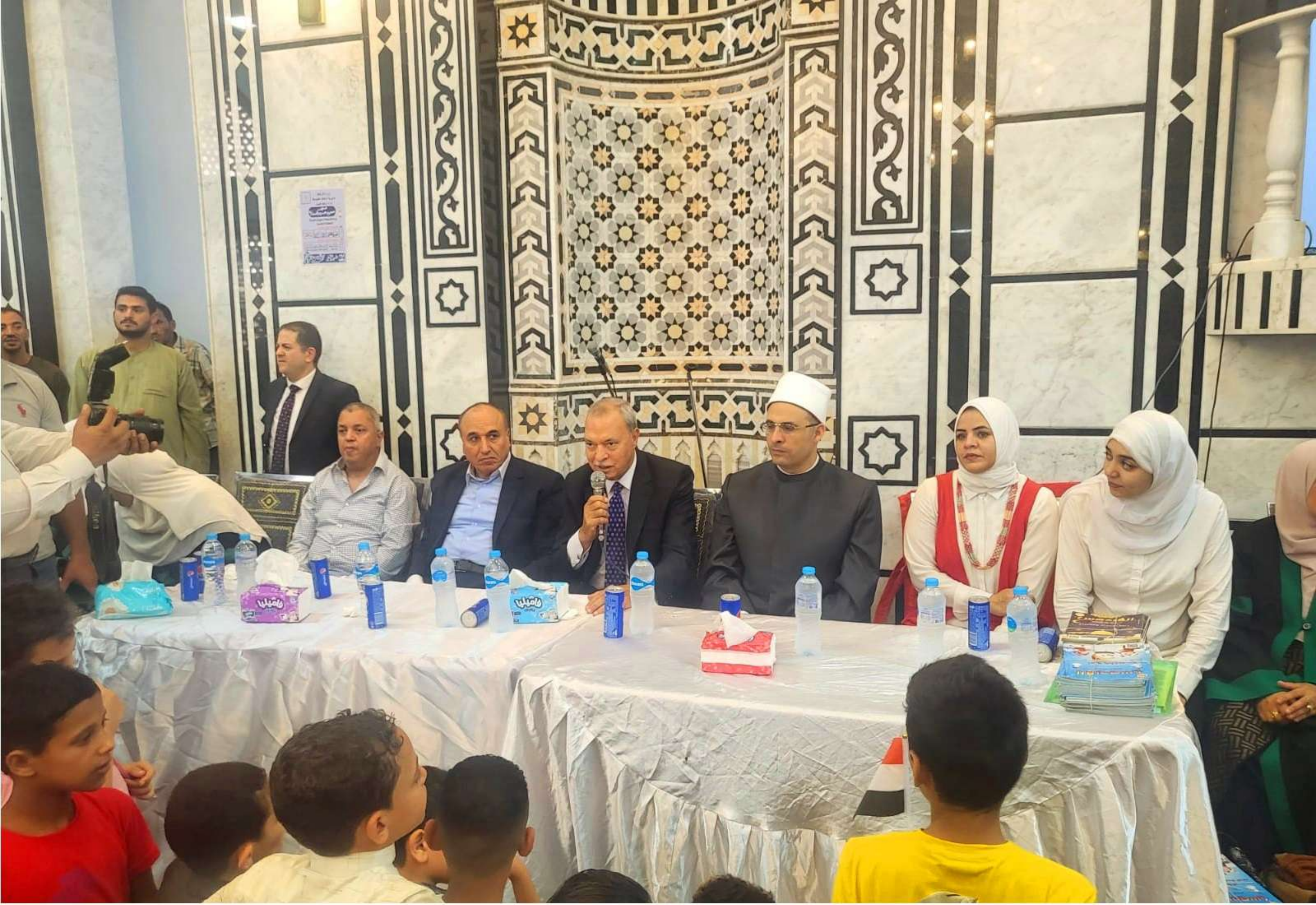
البرنامج الصيفي ٢٠٢٢م - مسجد مسعود حسن - عزبة السعادنة - كوم أشفين - القليوبية