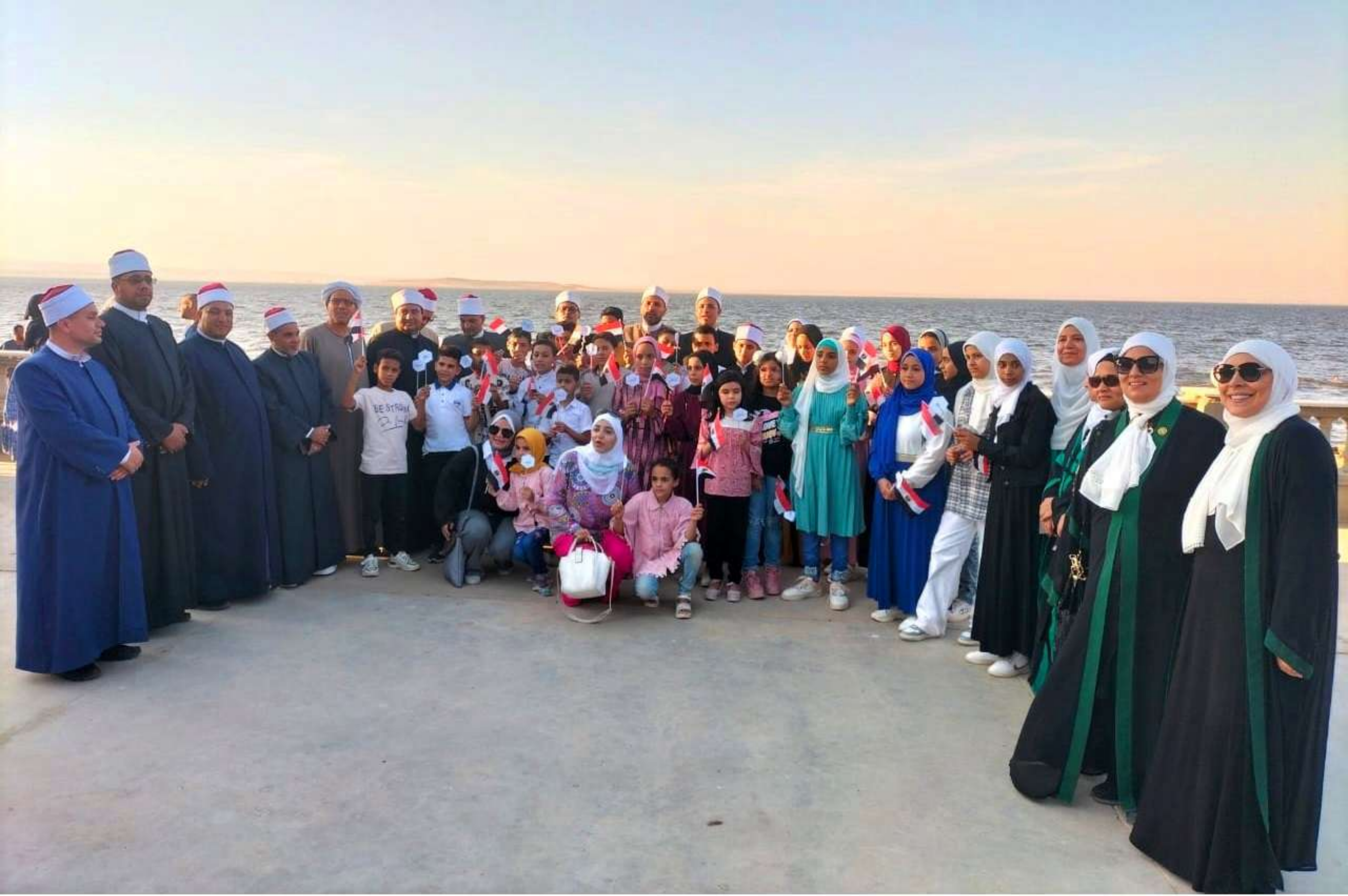
البرنامج الصيفي ٢٠٢٣ م - رحلة ترفيهية لأطفال الفيوم